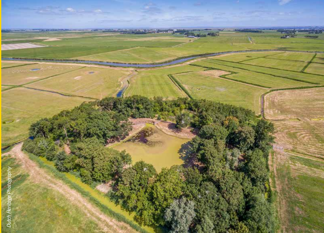
Dutch Heritage Photography