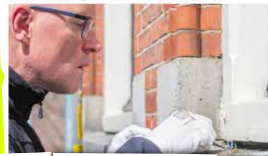
Natuurmuseum Fryslân 50e locatie Miniature People route