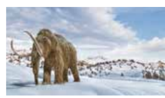
GEA-junior middag over IJstijden