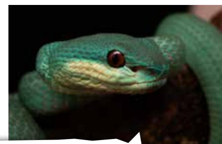
Nieuwe dieren in de GIF expositie

10.000e bezoeker voor GIF sinds de heropening